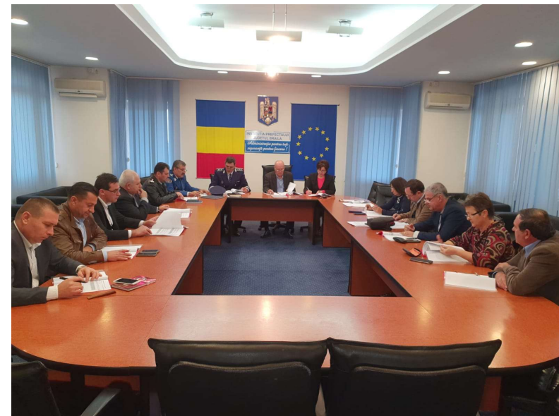
Sedinta analiza activitatii fortelor de ordine publica in anul 2019 - 24.10.2019