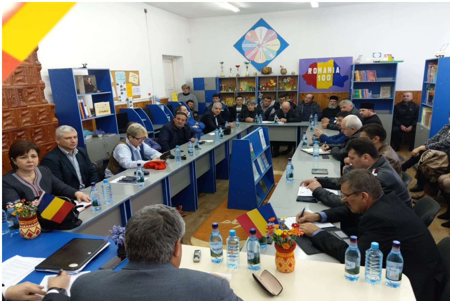
Dezbatere publică ATOP în comunele Ciocile și Baraganul - 21.03.2019

1) A organizat dezbateri publice în teren pentru cunoașterea climatului de ordine publica;