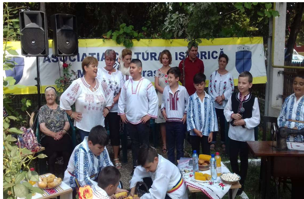
Asociatia Cultural Istorică „Muzeul” Ianca