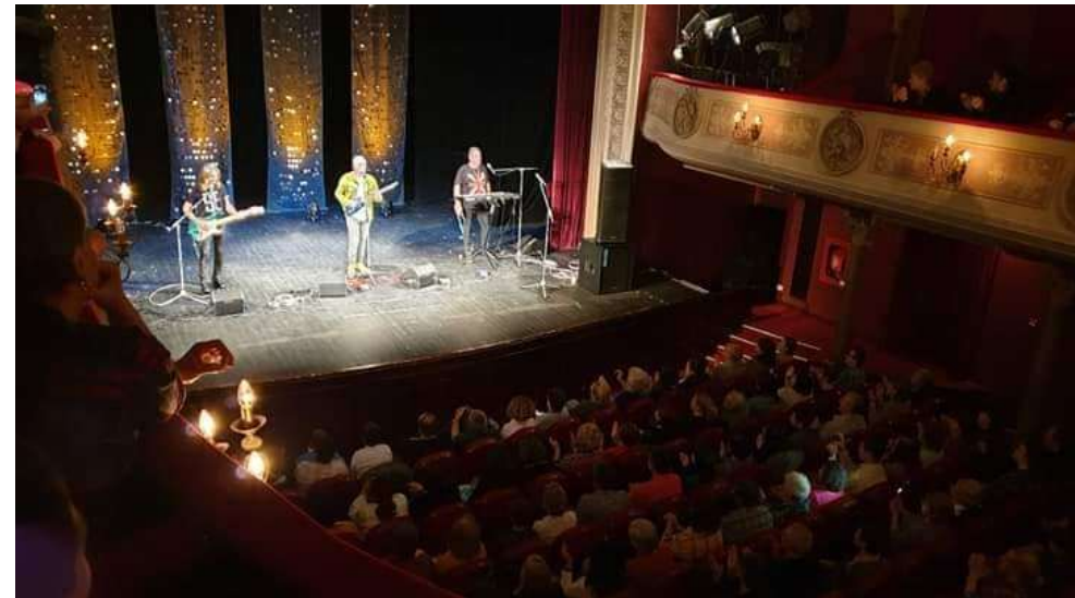
Festivalul Național de Folk „ Chira Chiralina ”