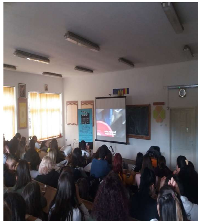
Asociatia Culturala Cinefeel