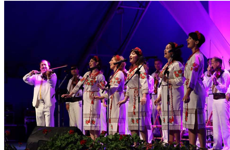
Festivalul Internațional de Folclor "Cântecul de dragoste de-a lungul Dunării"