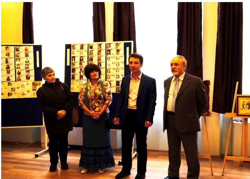
Mai mult decat portrete...

In data de 10 mai 2019 a avut loc la sediul centrului Concursul Interjudetean de Interpretare Muzicala „ Iannis Xenakis ”, editia a III-a, organizat de Liceul de Arte „Hariclea Darclee” Braila.