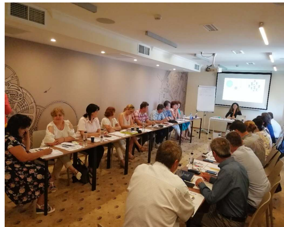
Strategia de dezvoltare a județului Braila 2021 – 2027