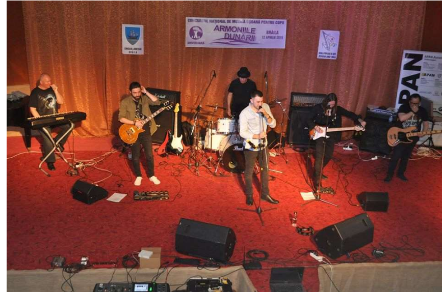
Concursul Național de Muzică Ușoară pentru Copii „Armoniile Dunării”