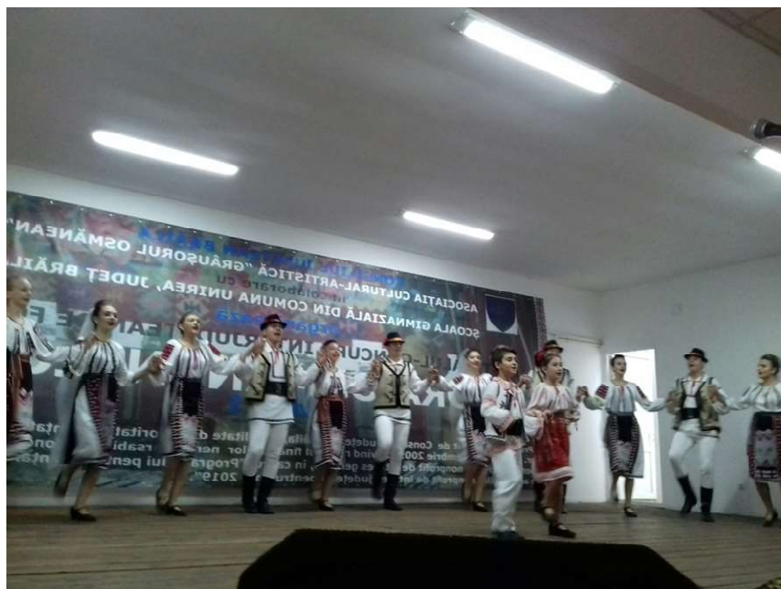
Asociatia Cultural Artistica „Grausorul Osmaneian”

La finalul derularii Programului pentru finantarea nerambursabila a activitatilor nonprofit de interes judetean pentru anul 2019 a fost intocmit Raportul anual, care a fost transmis spre publicare in Monitorul Oficial al Romaniei.