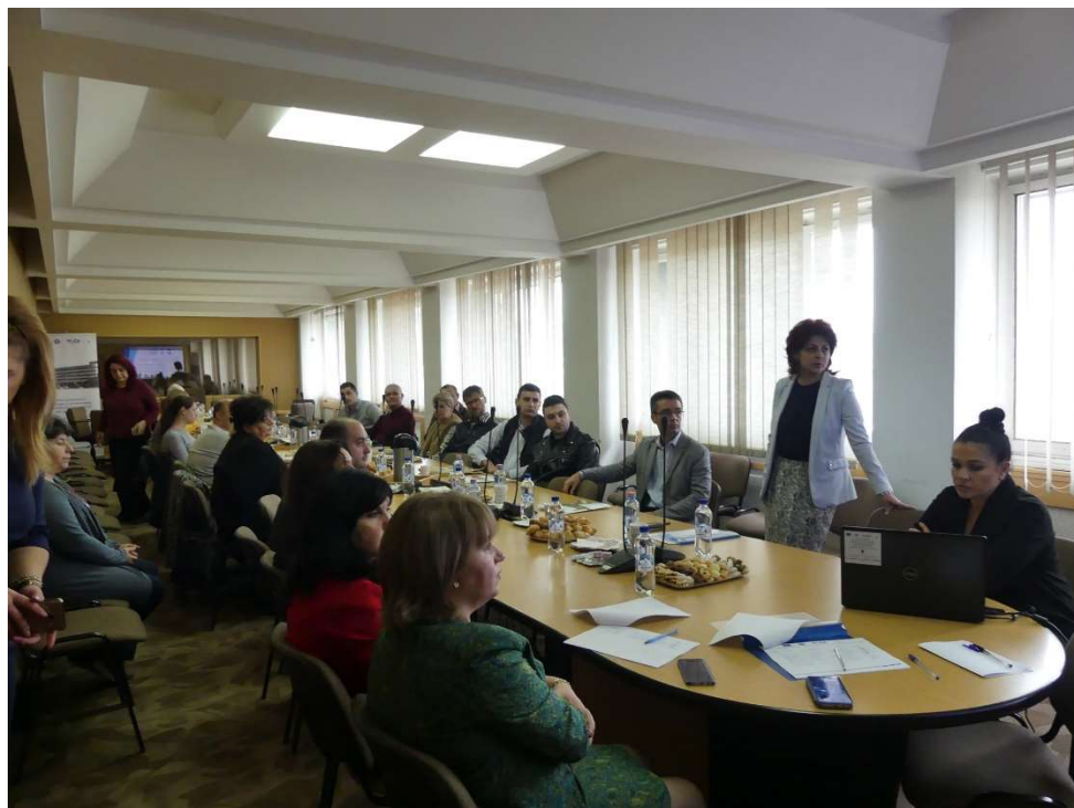
Calitate și performanța în administrația publică din județul Braila

S-a intocmit cererea de rambursare nr. 3, raportul financiar nr. 3 si raportul de progres aferent acestei cereri de rambursare. S-au desfasurat interviuri cu reprezentanta firmei Civitta Strategy & Consulting S.A. , in cadrul activitatii de evaluare a gradului de satisfactie al beneficiarilor Programului Operational Capacitate Administrativa privind sprijinul oferit de catre Autoritatea de Management.