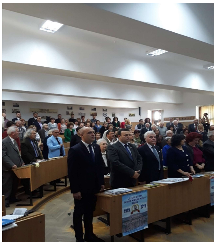
Asociatia de parinti ai elevilor din Colegiul National „Gh. M. Murgoci” Braila