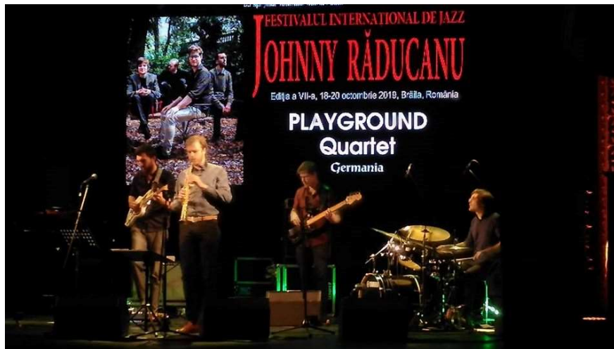
Concursul Internațional de Jazz „Johnny Răducanu”