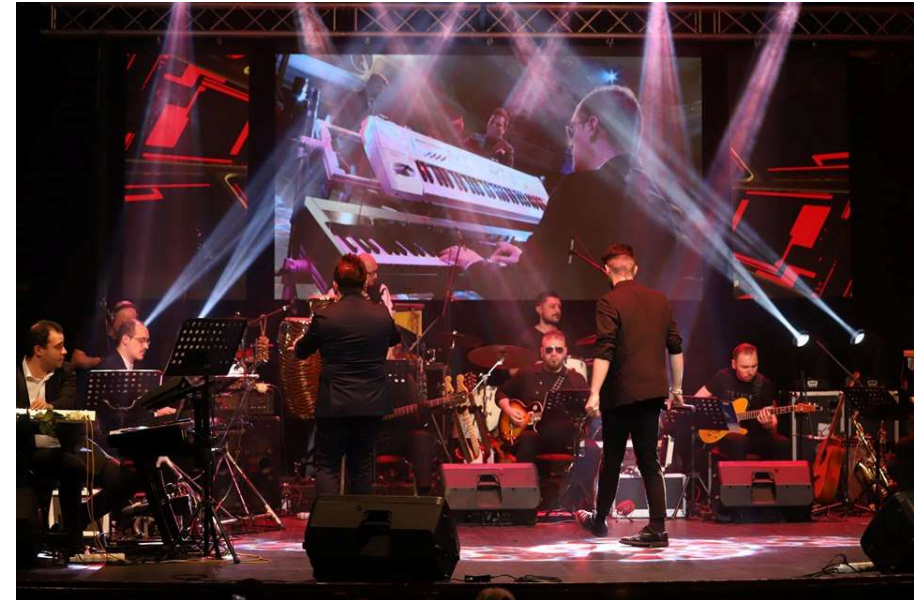
Festivalului Internațional de Muzică Ușoară „George Grigoriu”

8. Simpozionul Internațional de sculptură monumentală a “Nicăpetre” , ediția a IV-a, 5 august- 9 septembrie 2019, organizator: Muzeul Brailei “Carol I; locație: Colegiul tehnic “Costin D. Nenițescu” Brăila Soseaua Buzăului nr.15. Realizarea unor statui reprezentative în orașele Brăila, Ianca, Însurăței, Făurei, Tema: Mitul cultural și jertfelnic