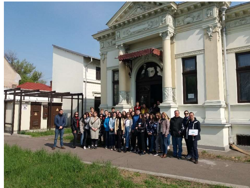
Vizitatori ai Centrului